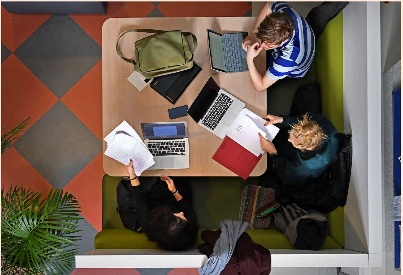
De gegevens van de meeste studenten staan inmiddels op een Amerikaanse cloud.